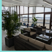
パーティールーム