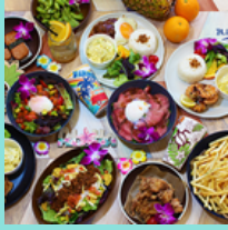
売店&カフェブルーテラス