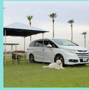
オートキャンプ場